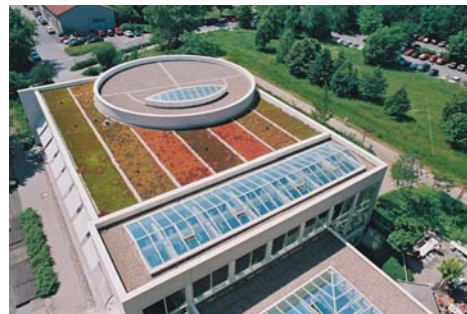
Krebsforschung, Uni Heidelberg