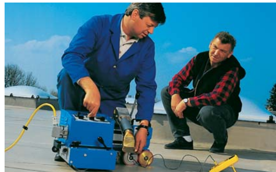
Hochwertige Materialien und kompetente Mitarbeiter gewährleisten ein optimales Ergebnis