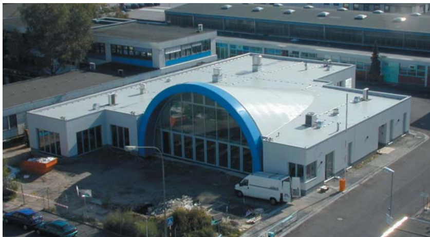
Kantine der MAN-Roland AG, Mühlheim