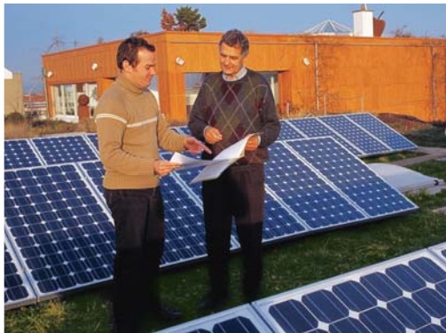
Die Geschäftsführer der DACHLAND GmbH