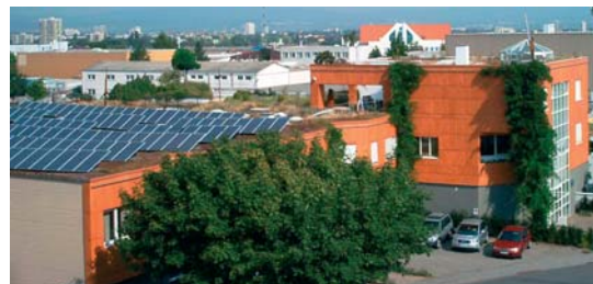
Der DACHLAND Firmensitz in Mainz

Mehr als 3 Millionen Quadratmeter verlegte Dachabdichtung im In- und Ausland.