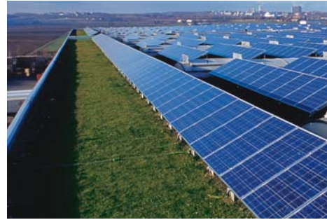
Spedition Kayser, Mainz