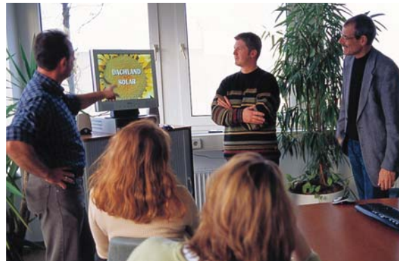
Leitende Mitarbeiter im Schulungsraum