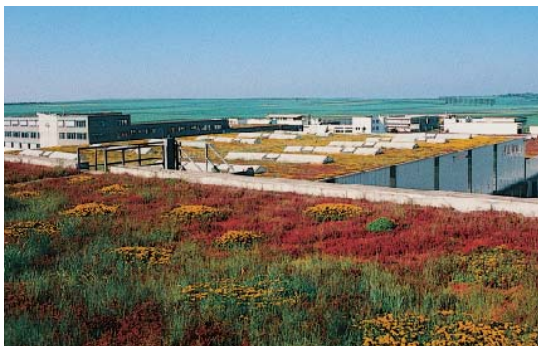
Spedition Kayser, Mainz