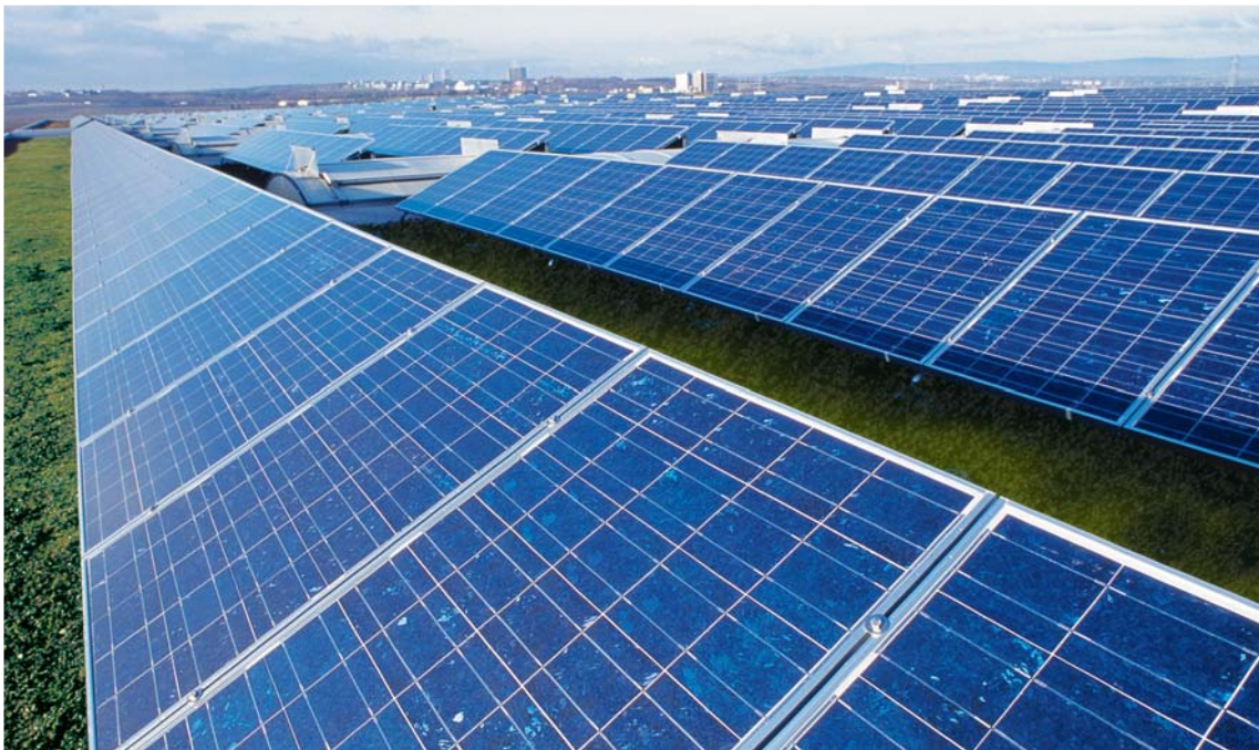
Photovoltaik-Anlage auf dem Dach der Spedition Kayser, Mainz