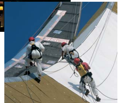
Antwort auf spezielle Anforderungen: Die Bergsteiger- Ausbildung und- Ausrüstung der Mitarbeiter von DACHLAND für die Arbeiten am Dach des Tempodroms.

Um neue architektonische Ideen zu realisieren und gestalterische Freiräume auszunutzen, sind auch bei der Dachabdichtung Lösungen erforderlich, die Kreativität, Zuverlässigkeit und Wirtschaftlichkeit in sich vereinen. Aus diesem Grund vertrauen immer mehr Architekten und Bauherren bei mechanisch fixierten Dächern auf Abdichtungssysteme von DACHLAND – wohl wissend, dass diese ausschließlich von gut geschulten und TÜV-zertifizierten Mitarbeitern verlegt werden. Aus umweltverträglichen, flexiblen Polyolefinen fertigen wir sichere, langlebige Abdichtungen. Sie passen sich durch die thermische Verschweißung vor Ort auch den noch so ausgefallenen Dachgestaltungen perfekt an. Das macht sie überall dort zur optimalen Lösung, wo anspruchsvolle Gebäude neu errichtet oder saniert werden.