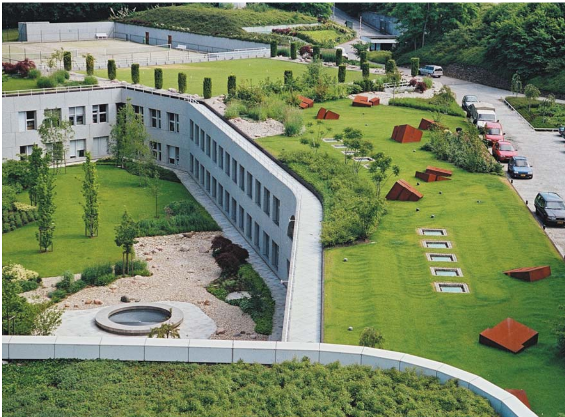
Europäische Investment Bank, Luxemburg