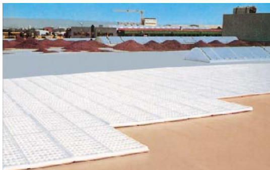
DAKU-Speicher-/Drainelemente mit einem Regenwasser-Speichervolumen von ca. 16 l/qm